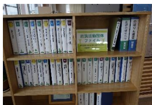
市民活動団体ファイル

団体内での連絡等に活用できるほか、来館者が団体の最新活動情報入手することができます。