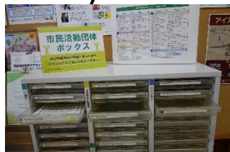
市民活動団体ボックス

団体内での連絡等に活用できるほか、来館者が団体の最新活動情報入手することができます。